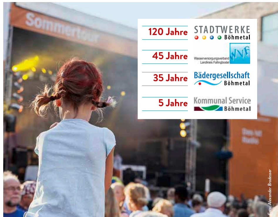
Auch die NDR-Sommertour macht am 19. August 2017 in Walsrode Station.

Die Veranstalter behalten sich Änderungen oder Absagen ausdrücklich vor. Der Rechtsweg ist ausgeschlossen.