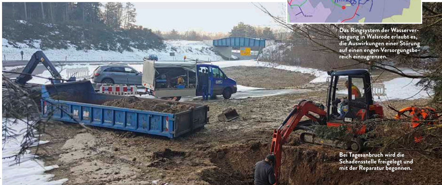
Bei Tagesanbruch wird die Schadensstelle freigelegt und mit der Reparatur begonnen.