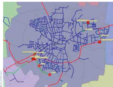
Das Ringsystem der Wasserversorgung in Walsrode erlaubt es, die Auswirkungen einer Störung auf einen engen Versorgungsbereich einzugrenzen.

Störungsauslöser waren extreme Temperaturschwankungen durch den Wechsel von Bodenfrost und Tauwetter und damit verbundene Spannungen und Bodenbewegungen.